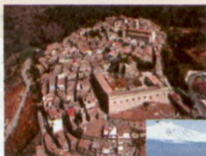
A sin., Montalbano Elicona; sotto, Taormina e la sua costa.

na presso il ristorante dell'hotel, il Convivio, dove lo chef Vincenzo Pinto propone alcune delle sue ricette più gustose con prodotti tipici come il famoso suino del Nebrodi; visita guidata al borgo medievale di Montalbano Elicona con escursione al pianoro dell'Argimosco per osservare l'eclissi; possibilità di escursione alle gole dell'Alcantara. € 165 a persona per due notti (eventuale notte extra € 75 mezza pensione). (Tel. 0941/670078).