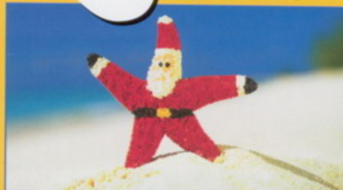
Viaggi di Natale & Capodanno